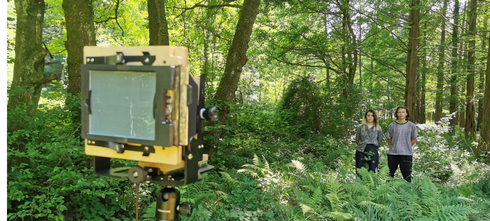
Oživljanje starih fotografskih tehnik – v tem primeru mokri kolodij – z mentorjem Borutom Peterlinom.

V sklopu vertikalne programov, triletnega diplomskega Digitalne umetnosti in prakse ter dvoletnega magistrskega Medijske umetnosti in prakse , študentje krožijo v okoljih in nosilnih modulih animacije, fotografije, filma, novih medijev, scenografskih prostorov in sodobnih umetniških praks , v magistrskem programu se gibljejo tudi med partnerskimi univerzami med Gorico, Gradcem in drugimi.