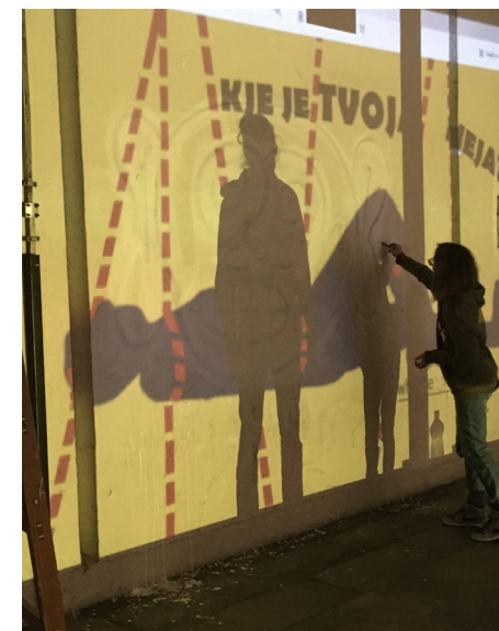
V delavnici Mapiranje meja so študentje iz Beograda, Krakova, Budimpešte, Reke in Nove Gorice preizpraševali tako svoje kot tudi družbene in specifične lokalne meje med Slovenijo in Italijo v obeh Goricah.