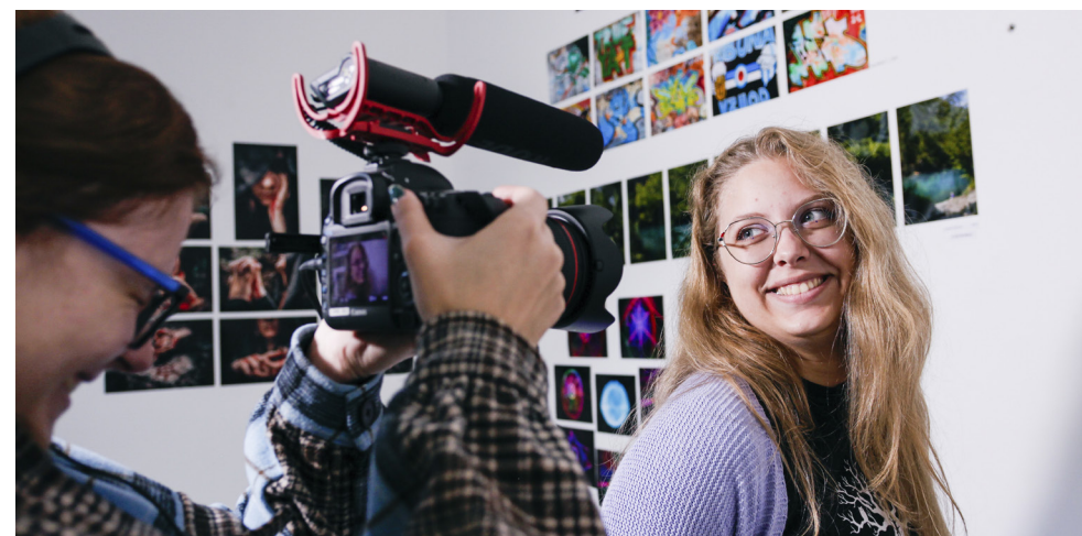
Delavnica s poudarkom na tehničnih vidikih filmskega ustvarjanja z mentorji iz področij kamere, zvoka, montaže.

Po sodelovanju pri oživljanju zgodovinskega Fužinskega gradu (1994-2004) in soočenjem z novodobnim podhodom Bežigrskega dvora (2004-2012), takrat še kot Šola Famul Stuart v Ljubljani, je šola med delovanjem v Gorici na italijanski strani odrasla v Akademijo umetnosti. Sedaj interakcijo z bližnjo in daljno okolico nadaljuje tik ob meji, v novogoriški Rožni Dolini.